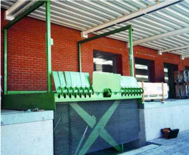
Verladehebetisch mit Portal als Absturzsicherung

Angebote und Preise auf Anfrage - Beispielanlagen: