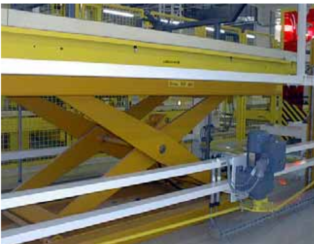
Hebetisch in einem Skidstapler