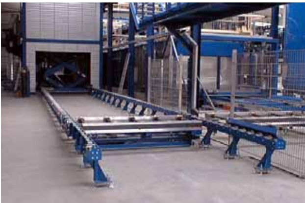
Hebetisch in einer KTL Lackieranlage in einem A-Schleusen Trockner. Der Oberrahmen ist mit Tragkettenförderer ausgerüstet. Zum Schutz vor der Hitze im Trockner ist der Oberrahmen des Hebetisches isoliert.