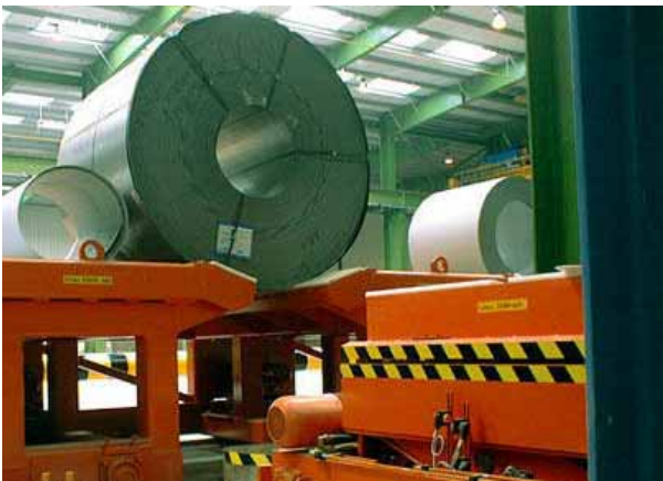
Bundhubwagen und fahrbares Bundlager