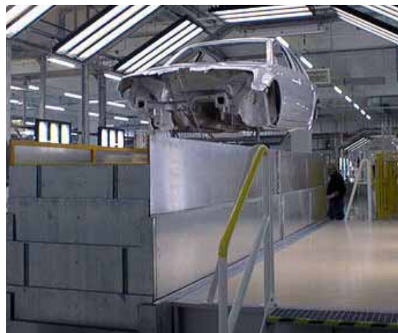
Hebetisch in einer Lackieranlage. Blechverkleidung 3-fach teleskopierend zur Absicherung von Quetsch- und Scherstellen