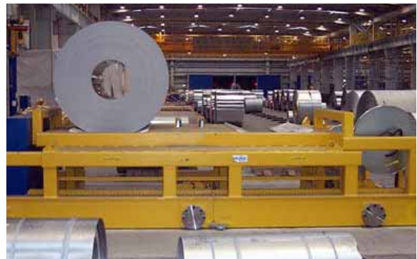
Fahrbares Bundlager mit Coilauflagen für 2 x 30 to Coils