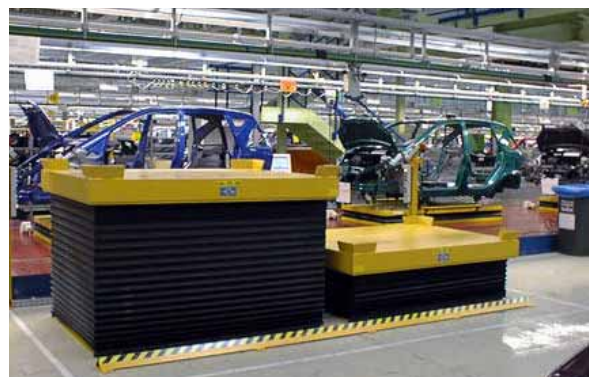
Hebetisch an einer Schubschienenanlage zur Arbeitserleichterung in der Automobilindustrie. Zum Schutz vor der Scherenkonstruktion ist ein allseitiger Faltenbalg montiert.