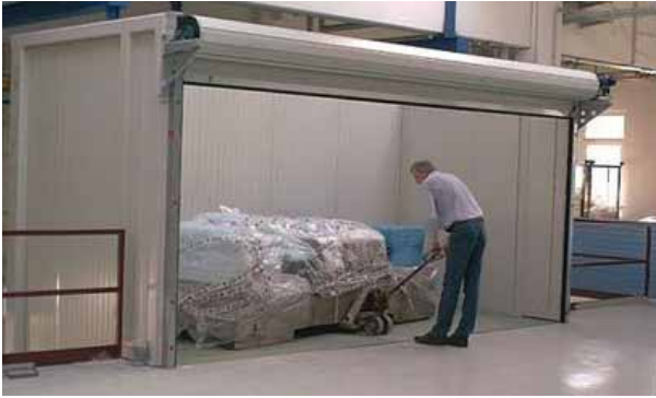
Güteraufzug mit elektrischen Rolltoren