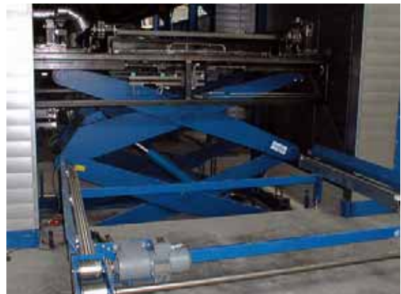
Um eine sichere Übergabe des Warenträgers auf den Kettenförderer zu gewährleisten, ist der Hebetisch mit einer Bolzenverriegelung ausgestattet. Die Isolierung ist hier zur besseren Ansicht demontiert