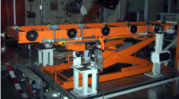
Hebetisch im Rohbau mit Spindelantrieb