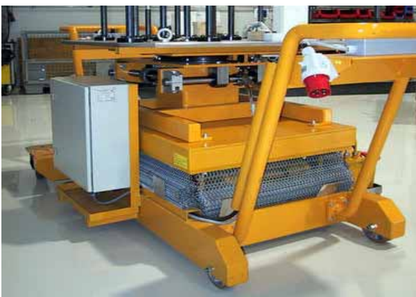
Hebetisch zur Montage des Motors in der Automobilindustrie im Prototypenbau