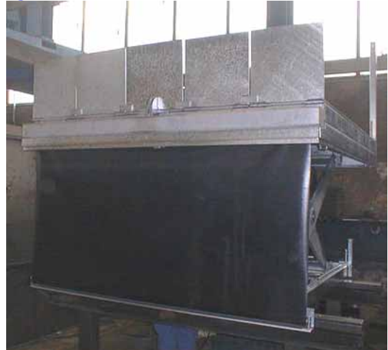
Rollo an verzinktem Verladehebetisch